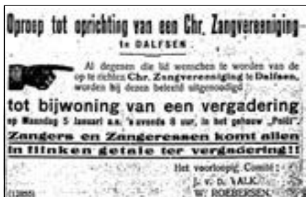
▲ Advertentie uit de Dalfser Courant van 2 januari 1931.