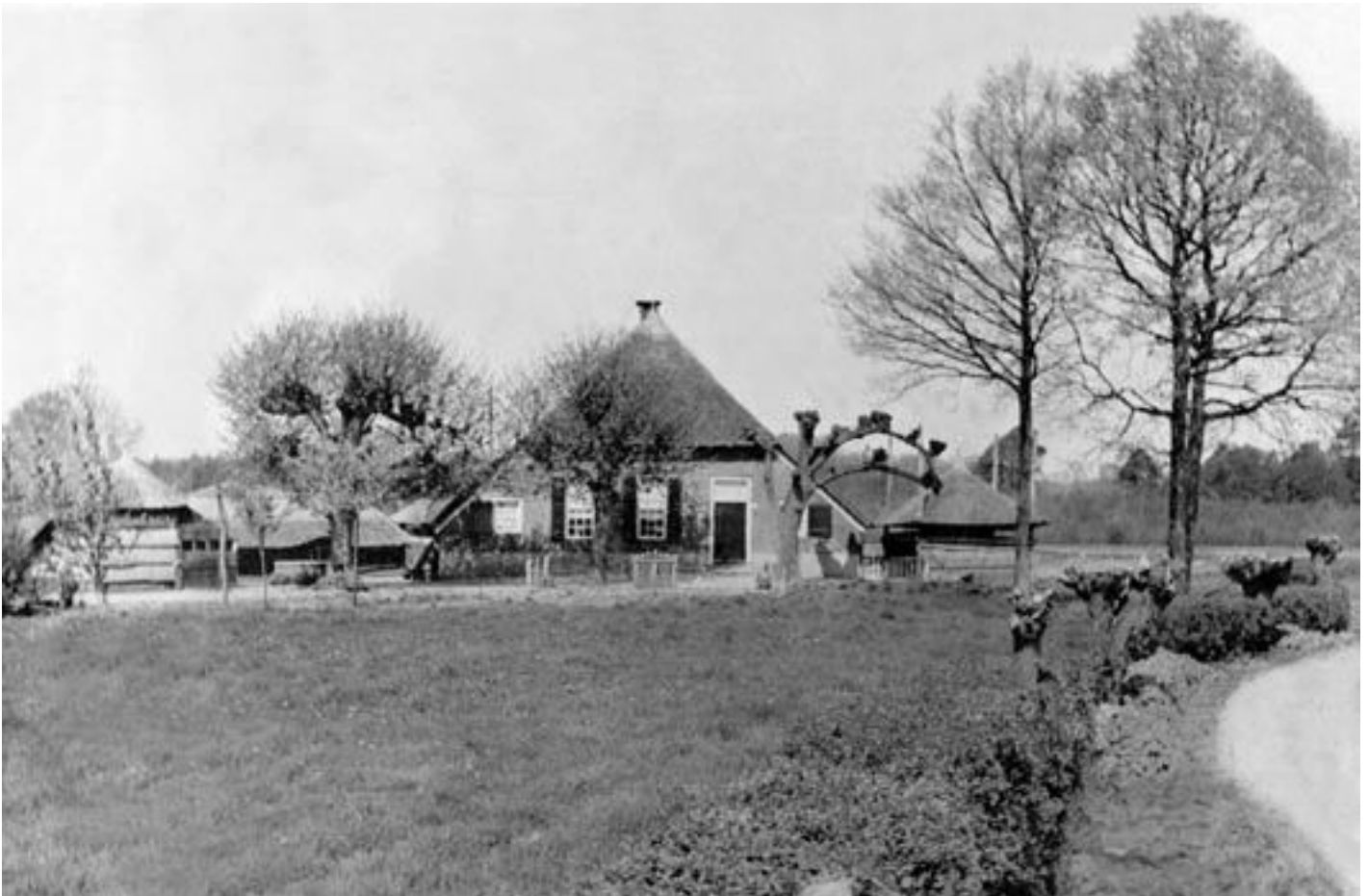
▲ Boerderij Klein Rekkelaar gelegen aan de Heinoseweg nr. 8.