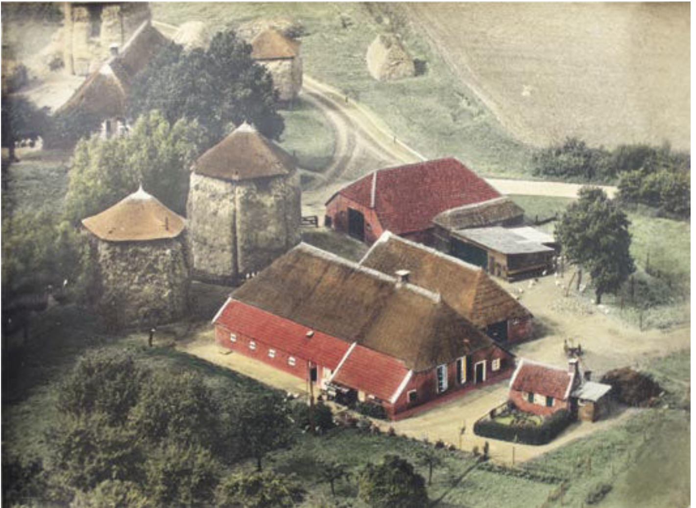
▲ Luchtfoto van de boerderij Groot Rekkelaar (±1951) gelegen aan de Heinoseweg nr. 7.