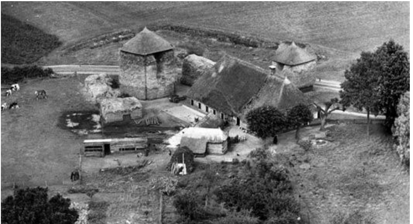
▲ Luchtfoto van de boerderij Klein Rekkelaar (1951) gelegen aan de Heinoseweg nr. 8.

Toen in 1583 de Spaansgezinde overheid een lijst opstelde van de erven in Salland die aan vijanden van de Spaanse koning toebehoorden, wer-