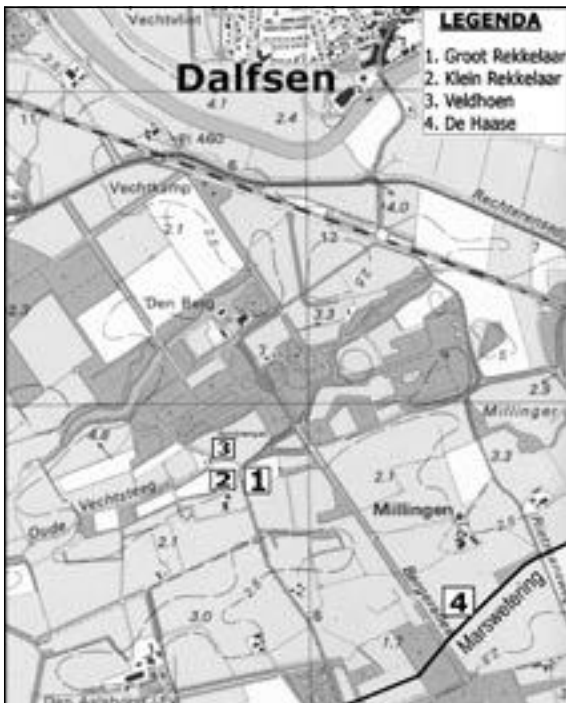
▲ Situatiekaart op ondergrond van een topografische kaart van 1984/1988.

den daarin ook de bezittingen opgesomd van Goessen van Coevorden. Hiertoe behoorde: