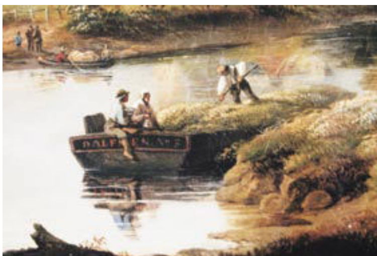
Hierboven: 3 Detailfoto's.