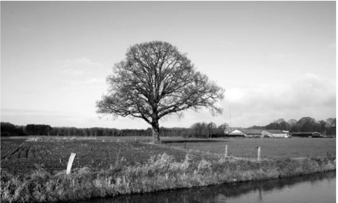
▲ Aan de Bergera waar de vroegere katerstede heeft gestaan. Op de achtergrond de boerderij van de familie H. Schuttert, Rietmansweg 4. Foto: Henk van der Beeke, januari 2006.

In het kadastrale minuutplan van 1830 heet Groot Rekkelaar Bruinink. De herinnering aan de naam Bruins is dus nog lang na het vertrek van het geslacht Bruins aan Groot Rekkelaar verbonden gebleven.