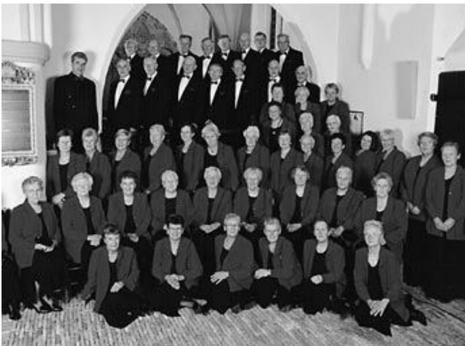
▲ Jubileumfoto genomen bij het 75-jarig bestaan van Soli Deo Gloria.

den, gezellig met z'n allen in de bus en er een leuke dag aan vastknopen. Vol goede moed gingen we dan ook naar Avifauna om daar als sijsjes te gaan zingen. Maar ..... we zongen er voor ons gevoel "als valse kraaien" (dit lag volgens ons aan de entourage van het gebouw); de beoordeling was dan ook niet best. We gingen met ons allen letterlijk en figuurlijk de boot in en lieten de zangresultaten dan ook maar in het water zakken. Zo gaf de boottocht op het Braassemermeer ons weer het gevoel een dagje uit te zijn. We konden de dag, ondanks het slechte zangresultaat, maar dankzij de verfrissende boottocht, met een gezellig etentje afsluiten. In oktober 1995 werd een stroopwafelactie georganiseerd. De leden gingen huis-aan-huis om stroopwafels te verkopen. Van het opgebrachte geld werd nieuwe koorleding aangeschaft en dus kwamen we bij het 65-jarig jubileum in 1996 weer in het nieuw voor de dag. En ..... ten slotte mag een foto van een 75-jarig koor in nieuwe kleding in dit artikel niet ontbreken. We hopen met elkaar nog veel jaren met plezier te mogen zingen.