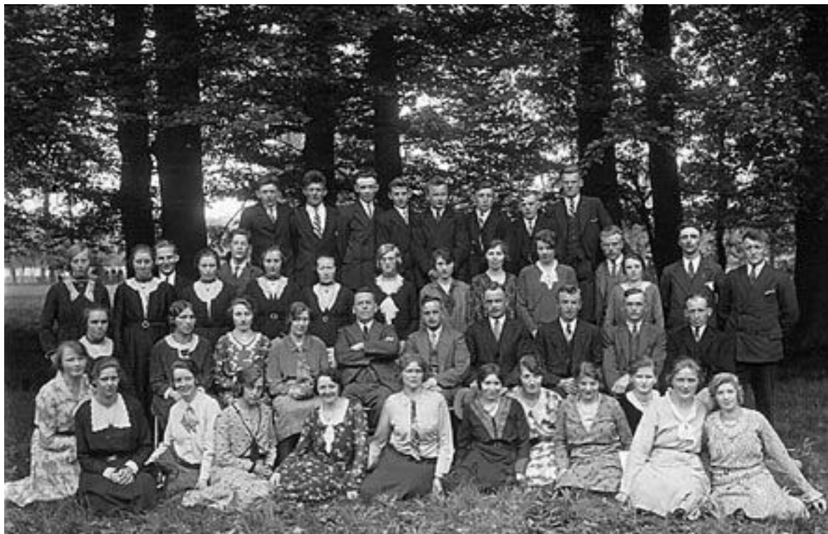
▲ Groepsfoto genomen van Soli Deo Gloria uit 1932.