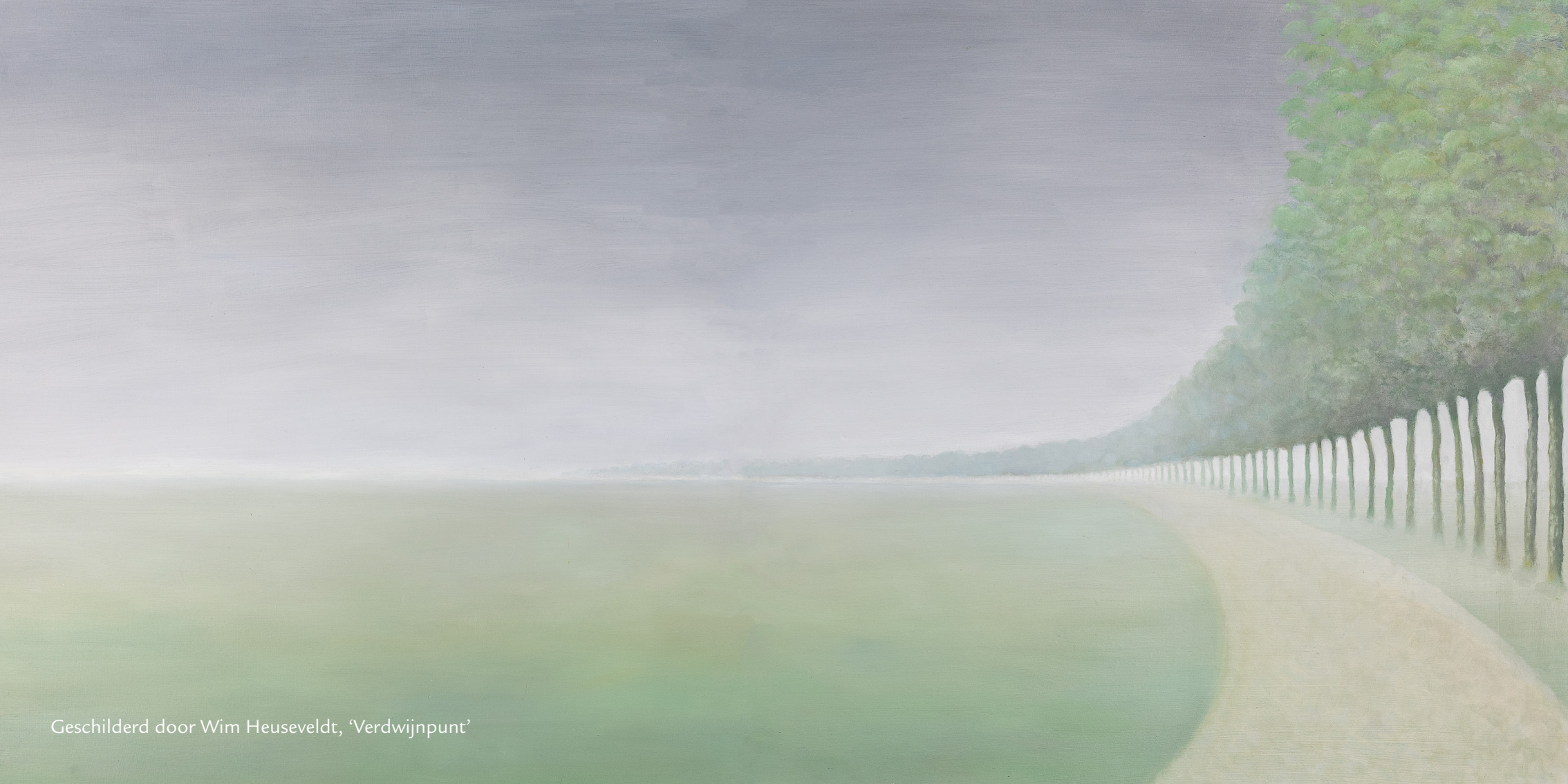
Geschilderd door Wim Heuseveldt, 'Verdwijnpunt'